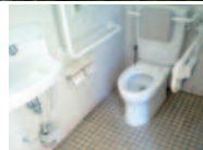
近隣トイレ/賢島駅南口観光用専用駐車場内公衆トイレ