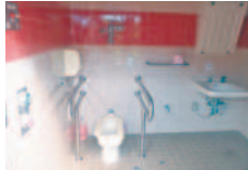
近隣トイレ/登茂山園地公衆トイレ