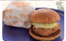
ご当地バーガー「勝っお(鰹)バーガー」美味しいよ!